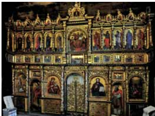
Jumalaema kiriku ikonostaas (Kutõ küla).