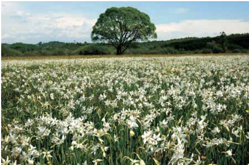
Imeline Nartsisside org.

Karpaatide pöögimetsad on aga kantud UNESCO maailmapärandi nimekirja.