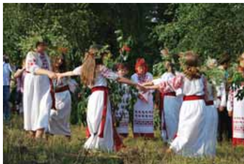
Ivana Kupala püha.

Ööl vastu 7. juulit tähistavad ukrainlased iidsetest aegadest Ivana Kupala püha, see langeb kokku Ristija Johannese pühaga. Tütarlapsed punuvad sel päeval põllulilledest pärgi, viskavad need õhtul vette ja jälgivad tähelepanelikult nende liikumist. Kui pärg ujub kenasti, saab tütarlaps aasta jooksul mehele; kui pärg keerleb ühe koha peal, pole meheleminekut veel mõnda aega oodata; kui aga pärg ujub kaldale, on sealtkandist peigmeest oodata juba samal ööl. Julgemad otsisid sõnajalaõit, mis avanes legendi