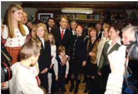
Ukraina president Viktor Juštšenko külas siinsetel ukrainlastel.

Ukraina Kultuurikeskus Tallinnas jagab vanalinnas ühist territooriumi Ukraina kreekakatoliku kirikuga ja moodustab osa sakraal- ja kultuuri-kompleksist. See kompleks on otsekui ukraina kultuuri näide ja samas Tallinna keskaegse arhitektuuri lahutamatu osa. Kultuurikeskuse ruume kasutavad Eesti Ukrainlaste Kongressi organisatsioonid. Seal tegutsevad ka pühapäevakool Labora, käsitöö ja kloostrikunstide kool, raamatukogu ja muuseum. Samuti on keskuses sisustatud töökoda, kus keskaegset tehnoloogiat kasutades valmistatakse käsitsi paberit. Kultuurikeskus korraldab ukraina keele ja kalligraafia kursusi, toimuvad käsitöö, paberivalmistamise ja teisedki meistriklassid. 2005. aastal külastas Ukraina Kultuurikeskust Tallinnas Eesti president Arnold Rüütel abikaasaga, 2006. aastal olid külalisteks Eesti president Toomas Hendrik Ilves ja Ukraina president Viktor Juštšenko, 2007. aastal tutvus keskusega Eesti peaminister Andrus Ansip.