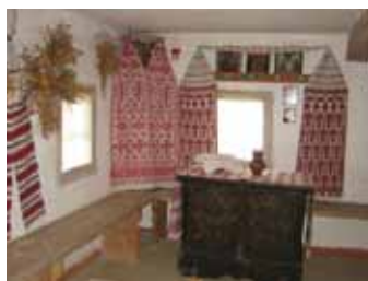
Ukraina maja seestpoolt.