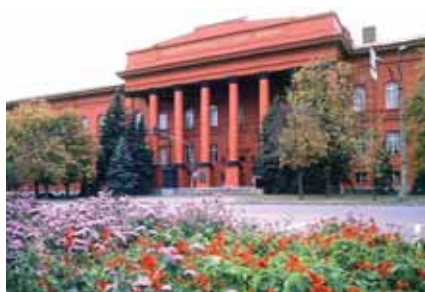
Tarass Ševtšenko nimeline Riiklik Ülikool.