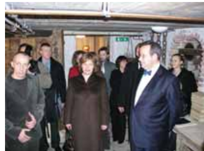
Eesti president Toomas Hendrik Ilves kohtub siinsete ukrainlastega.

Ukraina Organisatsioonide Assotsiatsioon Eestis asub Tallinnas Ukraina saatkonna ja Kadrioru pargi lähistel. Organisatsiooni juures tegutsevad pühapäevakool Nadija, muusika- ja vokaalkool. Korraldatakse kursusi ja seminare täiskasvanutele ning noortele, rahvakunsti püsinäitusi, töötab raamatukogu. Aset leiavad kohtumised Eesti, Euroopa ja Ukraina riigiametnike ja kultuuritegelastega.