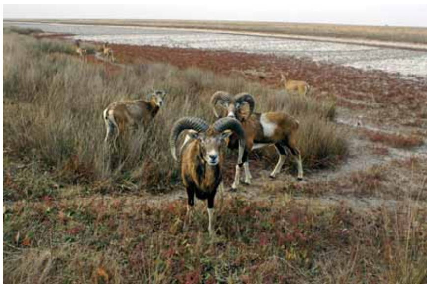
Muflonid Aasovi-Sõvaši looduspargis.

Ukraina on hinnatud turismipiirkond. Tuntud on Krimmi lõunakaldal asuvad kuurordid (Jalta, Jevpatorija, Alušta) ning Odessa. Populaarsust on kogunud vesi- ja mudaravilad – Truskavets, Moršõn, Mõrgorod, Sakõ, Slovjansk, ning Karpaatides asuv mäesuusakuurort Bukovel.