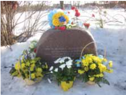
Mälestuskivi Tarass Ševtšenkole.