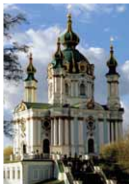
Püha Andri kirik.