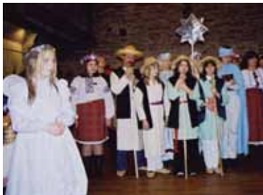
Jõulude ajal esitavad noored traditsioonilise jõulunäidendi.

Lastele ja noortele korraldatakse Eesti eri paikades suve- ja talvelaagreid, laagreid organiseerib ka ukraina kirik. Lastel on samuti võimalus külastada Ukraina laagreid, kus nad saavad tundma õppida oma ajaloolist kodumaad.