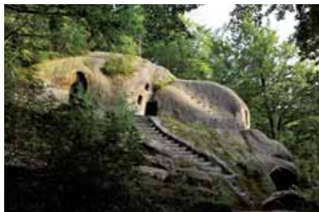
Kaljuklooster, mida esmakordselt on mainitud 1460. aastal.

Kristlus võeti ametlikult vastu 988. aastal vürsti Volodõmõr Suure ajal. Pärast suurt kirikulõhet 1054. aastal jäi ukraina kristlik kirik Konstantinoopoli patriarhi ja seega õigeusu mõju alla. Samas ei katkestatud kunagi suhteid Roomaga. Iseisvuse kaotamine, Konstantinoopoli langemine ja sunniiviisilise katoliseerimise oht poolakate poolt seadsid ukraina kiriku keerulisse olukorda. XVI sajandi lõpus otsustati üle minna Rooma paavsti alluvusse, ühtlasi säilitati traditsiooniline Bütsantsi riitus ja oma kiriku eripära. Sündis ukraina