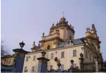
Püha Jüri katedraal.