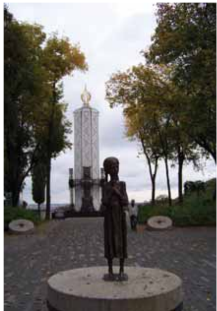
Näljahäda ohvrite memoriaal Kievis.

1960-ndatel aastatel levis riigis dissidentlik liikumine: astuti välja ühiskonna demokratiseerimise, inimõiguste ja ukraina keele vaba arengu eest. Liikumise tuumiku moodustasid noored kirjanikud ehk šistdesjatnõkõ (kuuekümnendate põlvkond). Kuigi