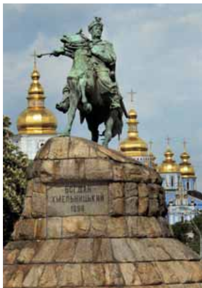
Mälestusmärk Bogdan Hmelnõtskile Kiievis.

1772. aastat jagati Ukraina alad kahe impeeriumi, Austria-Ungari ja Venemaa vahel.